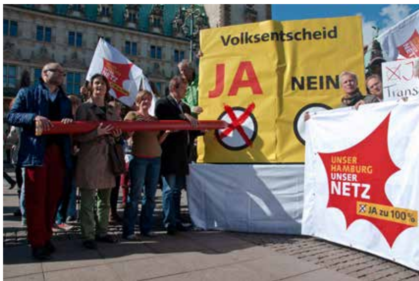
Referendo de Hamburgo, septiembre de 2013

en sí, como señaló uno de los organizadores de la campaña en una entrevista, la estrategia consistió en “convencer al 50 por ciento + x”, lo cual entrañó cuestiones como cómo “lograr el tono adecuado” para atraer a una mayoría de votantes. 13 Sin embargo, el afán remunicipalizador generó resistencias entre actores establecidos en la vida política local vinculada con la energía. En primer lugar, a finales de 2011 el gobierno de la ciudad —entonces socialdemócrata— aprobó una remunicipalización parcial del 25,1 por ciento y un llamado ‘concepto energético’ en cada uno de los servicios públicos. La idea era restar validez al argumento de que el estado local carecía de influencia en el ámbito del suministro de energía. En los meses previos al referendo, el debate público se fue intensificando cada vez más, en especial a partir de que se lanzara una campaña en contra de la remunicipalización total. Esta contaba con el apoyo de una coalición formada por los principales partidos políticos, asociaciones empresariales e incluso los mayores sindicatos del sector (véase el Cuadro II). Curio-