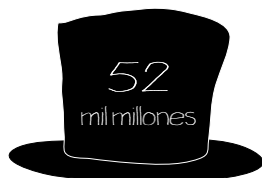
Hipó Real Estate

Coste de los rescates en euros, 2008/2009