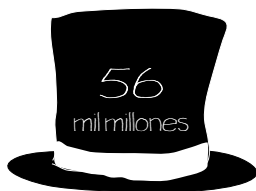
Royal Bank Scotland