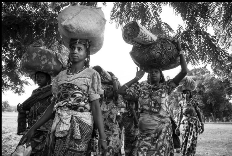
Mujeres desplazadas que transportan sus pertenencias llegan a Bossangoa, República Centroafricana, tras huir de la violencia.