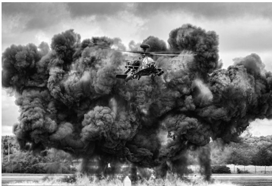
Las fuerzas armadas utilizan una gran cantidad de combustible y despliegan armas que tienen impactos ambientales duraderos.