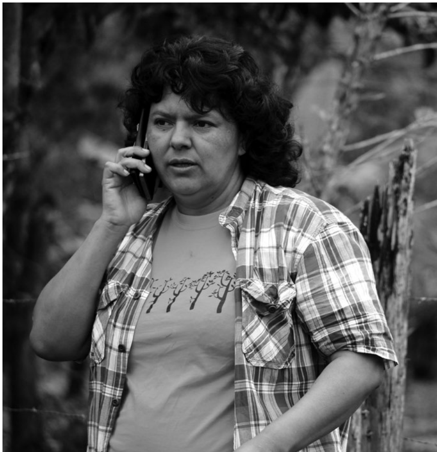
Berta Cáceres sostuvo "La Madre Tierra militarizada, cercada, envenenada, donde se violan sistemáticamente los derechos elementales, nos exige actuar".

Véase también: Orellana, A. (2021), Neoextractivismo y violencia estatal: Defendiendo a los defensores en América Latina . Estado del poder 2021. Amsterdam: Transnational Institute.