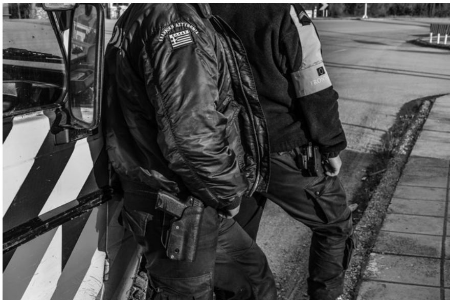
La Unión Europea ha aumentado el gasto fronterizo en más de 7000% desde 2005, lo que ha dado lugar a devoluciones en sus fronteras y al aumento del número de muertes, especialmente en el Mediterráneo. Foto de oficiales de Frontex y guardias de frontera griegos.