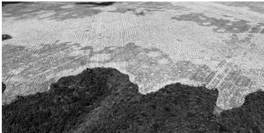
La deforestación en Brasil es causada por las exportaciones de la agricultura industrial.

Véase también: Hands on the Land (2016), Enfriando el planeta: las comunidades de la línea del frente encabezan la lucha , Ámsterdam: Transnational Institute.