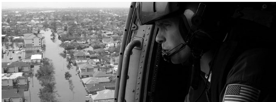
Varios sobrevivientes recibieron disparos de la policía y las fuerzas militares tras el Huracán Katrina en medio de la cobertura mediática racista acerca de los saqueos. Foto de un oficial de la guardia costera observando a Nueva Orleans bajo agua.

No hay duda de que los países necesitarán equipos eficaces de respuesta ante las catástrofes, así como la solidaridad internacional. Pero eso no tiene por qué estar vinculado a las fuerzas armadas, sino que podría recurrirse a una fuerza civil nueva o reforzada con un propósito humanitario exclusivo que no incluya objetivos contradictorios. Cuba, por ejemplo, con recursos limitados y en condiciones de bloqueo, desarrolló una estructura de Defensa Civil altamente eficaz e incorporada a cada comunidad que, combinada con comunicaciones estatales efectivas y asesoramiento meteorológico experto, le ayudó a sobrevivir a muchos huracanes con una cantidad de heridos y muertos menor que países vecinos más ricos. Cuando el huracán Sandy pasó por Cuba y Estados Unidos en 2012, solo 11 personas murieron en la isla caribeña, frente a 157 muertos en territorio estadounidense. Alemania también tiene una estructura civil (Technisches Hilfswerk/THW, la Agencia Federal de Socorro Técnico), en su mayoría integrada por voluntarios, que generalmente se utiliza para la respuesta ante catástrofes.