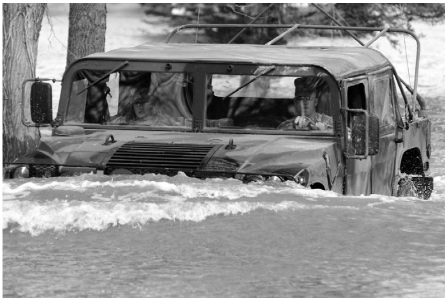
Soldados estadounidenses conducen vehículo en medio de inundaciones en Fort Ransom en 2009.

Si bien los organismos de seguridad nacional lideran el debate y fijan la agenda en materia de seguridad climática, también hay un número creciente de organizaciones no militares y movimientos sociales que abogan por prestarle mayor atención a la seguridad climática. Entre ellas se incluyen grupos de expertos en política exterior como el Brookings Institute y el Consejo de Relaciones Exteriores (CFR), de Estados Unidos, el Instituto Internacional de Estudios Estratégicos (IISS) y Chatham House, del Reino Unido, el Instituto Internacional de Investigación para la Paz de Estocolmo (SIPRI), Clingendael (Países Bajos), el Instituto de Relaciones Internacionales y Estratégicas (Francia), Adelphi (Alemania) y el Instituto Australiano de Política Estratégica. Uno de los principales defensores de la seguridad climática en el mundo es el Centro para el Clima y la Seguridad (CCS), un instituto de investigación con sede en Estados Unidos que mantiene lazos estrechos con el sector militar y de seguridad, así como con las jerarquías del Partido Demócrata. Varios de estos institutos, junto con militares de alto rango, fundaron el Consejo Militar Internacional sobre Clima y Seguridad (IMCCS) en 2019.