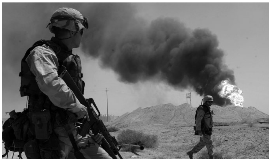
Soldados estadounidenses observan la quema de yacimientos petrolíferos tras la invasión de Estados Unidos en 2003.

6. Socava otras formas de lidiar con los impactos climáticos. Cuando la seguridad se convierte en el marco contextual, las interrogantes que surgen siempre son qué es lo que está inseguro, en qué medida y qué intervenciones de seguridad podrían funcionar, y nunca si la seguridad debería ser la estrategia siquiera. El asunto se establece en un binario de amenaza versus seguridad, que requiere la intervención del Estado y, a menudo, justifica acciones extraordinarias ajenas a las normas de la toma de decisiones democrática. Así se descartan otras estrategias, como aquellas que procuran analizar causas más sistémicas o centradas en valores diferentes (por ejemplo, de justicia, soberanía popular, alineación ecológica, justicia restaurativa), o basadas en diferentes organismos y enfoques (por ejemplo, el liderazgo de la salud pública, soluciones basadas en los bienes comunes o en la comunidad). También reprime a los mismos movimientos que reclaman estas estrategias alternativas y desafían los sistemas de injusticia que perpetúan el cambio climático.