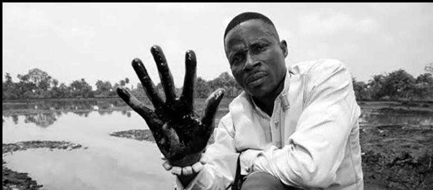
Contaminación petrolera en la región del Delta del Níger.

Fuente: Bassey, N. (2015) 'We thought it was oil, but it was blood: Resistance to the Corporate-Military wedlock in Nigeria and Beyond', de la colección de ensayos que acompaña a N. Buxton y B. Hayes (Eds.) (2015) Cambio Climático S.A. Cómo el poder [corporativo y militar] está moldeando un mundo de privilegiados y desposeídos ante la crisis climática . FUHEM Ecosocial y TNI.