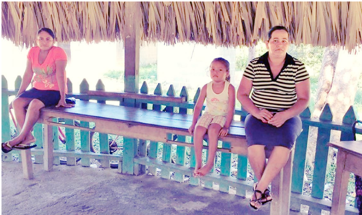
Integrantes de la comunidad Bajo Aguán. Enero de 2017

El Aguán representa una de las historias donde las diversas estrategias de control, apropiación y engaños hacia el campesinado se han manifestado en diversos momentos: a mediados de los años ochenta, el Estado de Honduras promovió la colonización de las tierras cultivables en el Valle del Aguán, 59 aprovechando su falta de ocupación y el retiro de la compañía bananera de sus antiguas fincas. 60