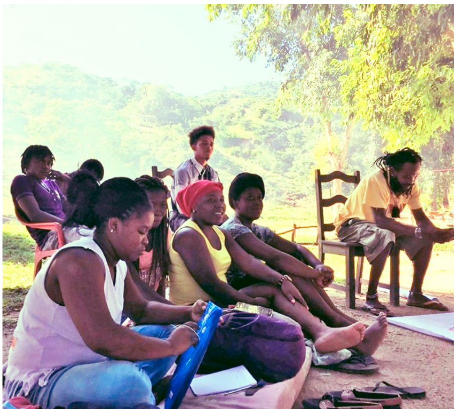
Jóvenes Garífunas de la comunidad de Guadalupe. Enero de 2017

Para el pueblo Garífuna, existe un vínculo indivisible entre ellos como comunidad, el mar y sus tierras. Es un aspecto cultural profundamente arraigado, que sufre en gran magnitud si se rompe; en especial, si esa ruptura es provocada de forma intencionada por la mano humana, como es el caso de las acciones de usurpación y despojo.