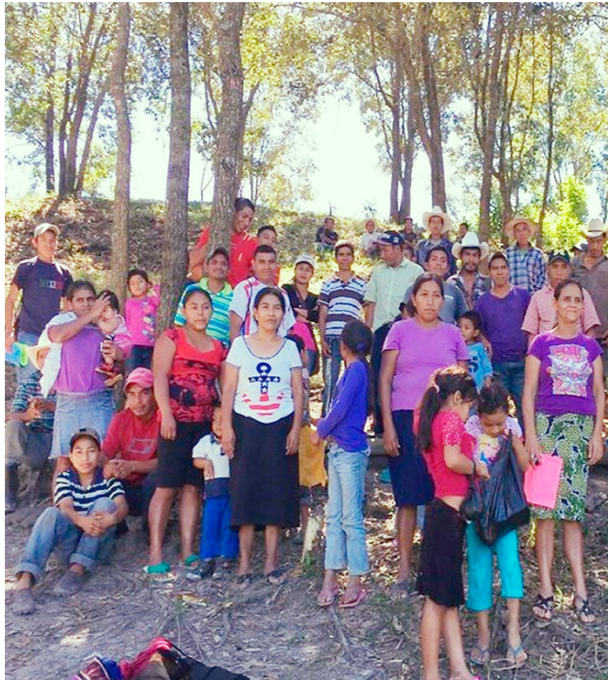
Integrantes de la comunidad de Río Blanco. Enero de 2107

De implementarse estos 42 proyectos hidroeléctricos, estaríamos ante la presencia de un suicidio ecológico de graves consecuencias para el país y la región centroamericana.