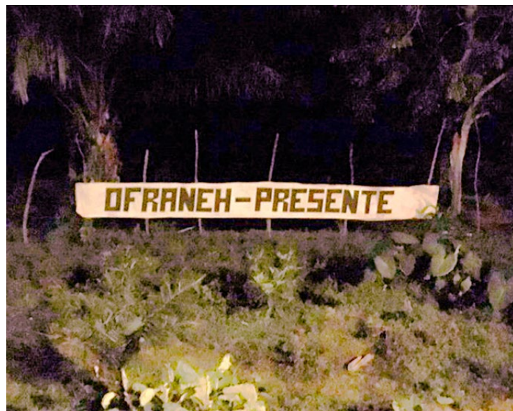
¡La lucha continúa! Comunidad Guadalupe. Enero de 2017

CareVida tiene también en desarrollo el proyecto Njoi, un proyecto habitacional en bloques o colonias (distintos lugares de la zona) destinado a extranjeros retirados que deseen vivir en el Caribe hondureño. Cada colonia de Njoi es una verdadera burbuja, amurallada o separada del resto de la población. Se reproduce aquí el antiguo modelo de enclaves, ahora turísticos, en el cual el despojo de las comunidades es la condición para crear espacios aislados, donde la conservación de la naturaleza constituye más una función ornamental, desconociendo la relación que se ha generado históricamente entre la comunidad y su territorio.