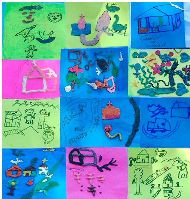
Trabajo manual de los niños y las niñas en la comunidad de Río Blanco, donde expresan sus visiones y sentimientos acerca del Río Gualcarque. Enero de 2017

El pueblo Garífuna: Se presenta la experiencia de OFRANEH, en la comunidad Garífuna de Guadalupe, en el municipio de Santa Fe, departamento de Colón, que enfrenta una lucha frente al despojo de sus territorios ancestrales por parte de las corporaciones de turismo.