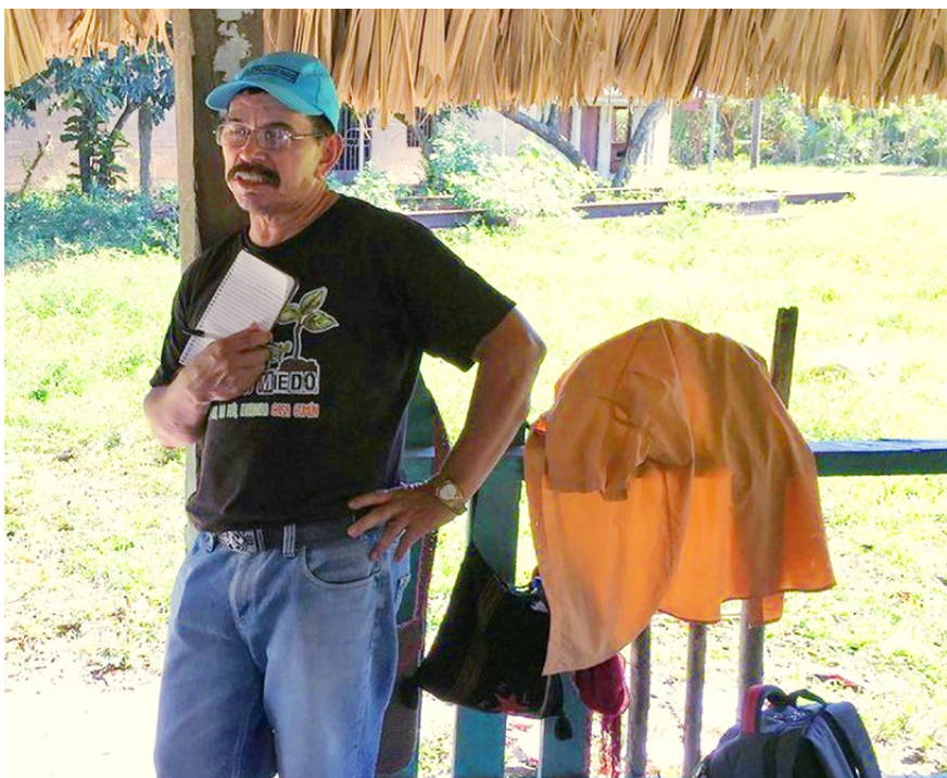
Integrante de la comunidad Bajo Aguán. Enero de 2017