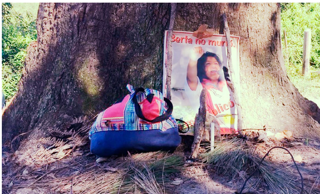
Berta Presente! Río Blanco. Enero de 2017

Berta fue víctima también de diversos atropellos. Aunque resulte paradójico, las autoridades del Estado que hoy se erigen como poder exclusivo para investigar su asesinato, negándose a compartir las responsabilidades con expertos objetivos y confiables, son las mismas que en el pasado se negaron a protegerla y brindarle garantías para su seguridad. 37