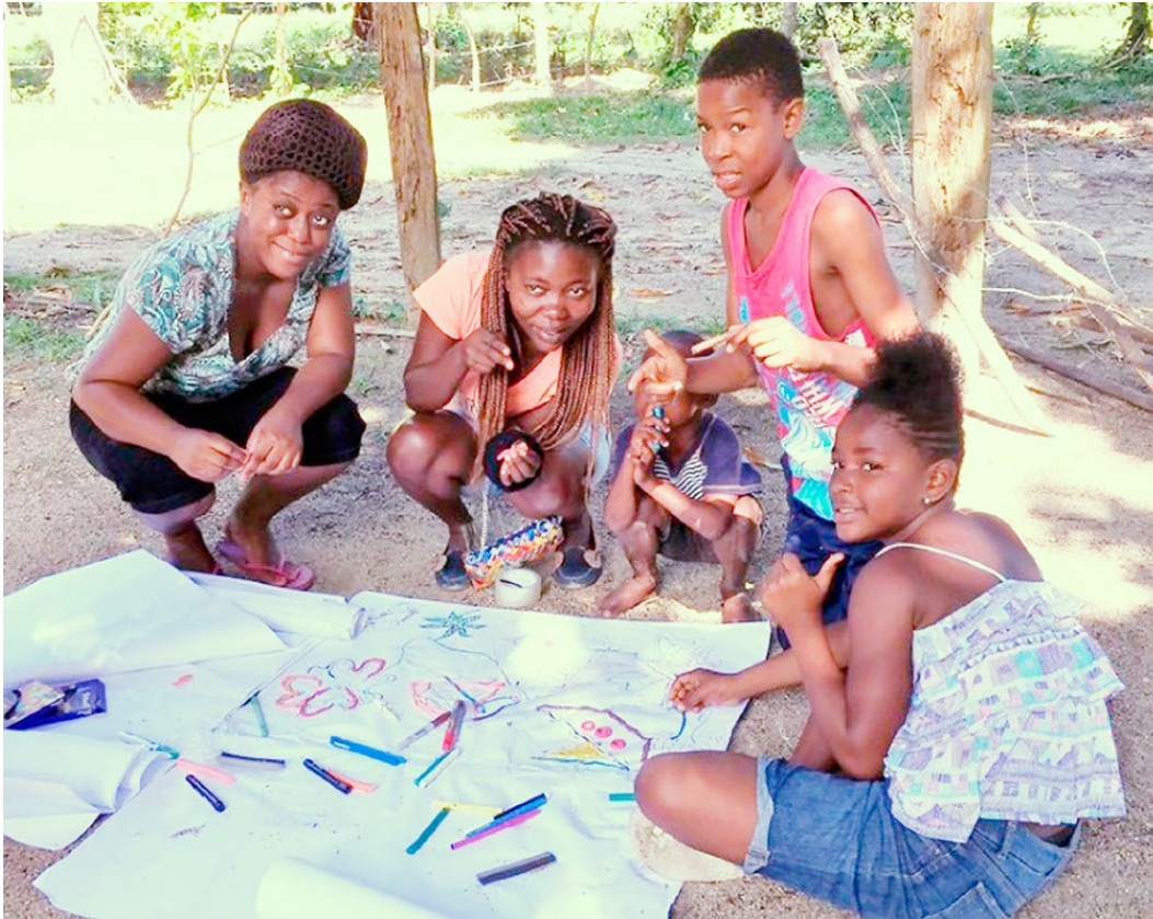
Jóvenes Garífunas de la comunidad de Guadalupe expresando su sentir sobre el mar. Enero de 2017

En el contexto de defensa de sus derechos culturales y territoriales, el pueblo Garífuna entiende que estos son vulnerados en el siguiente orden de prioridad: