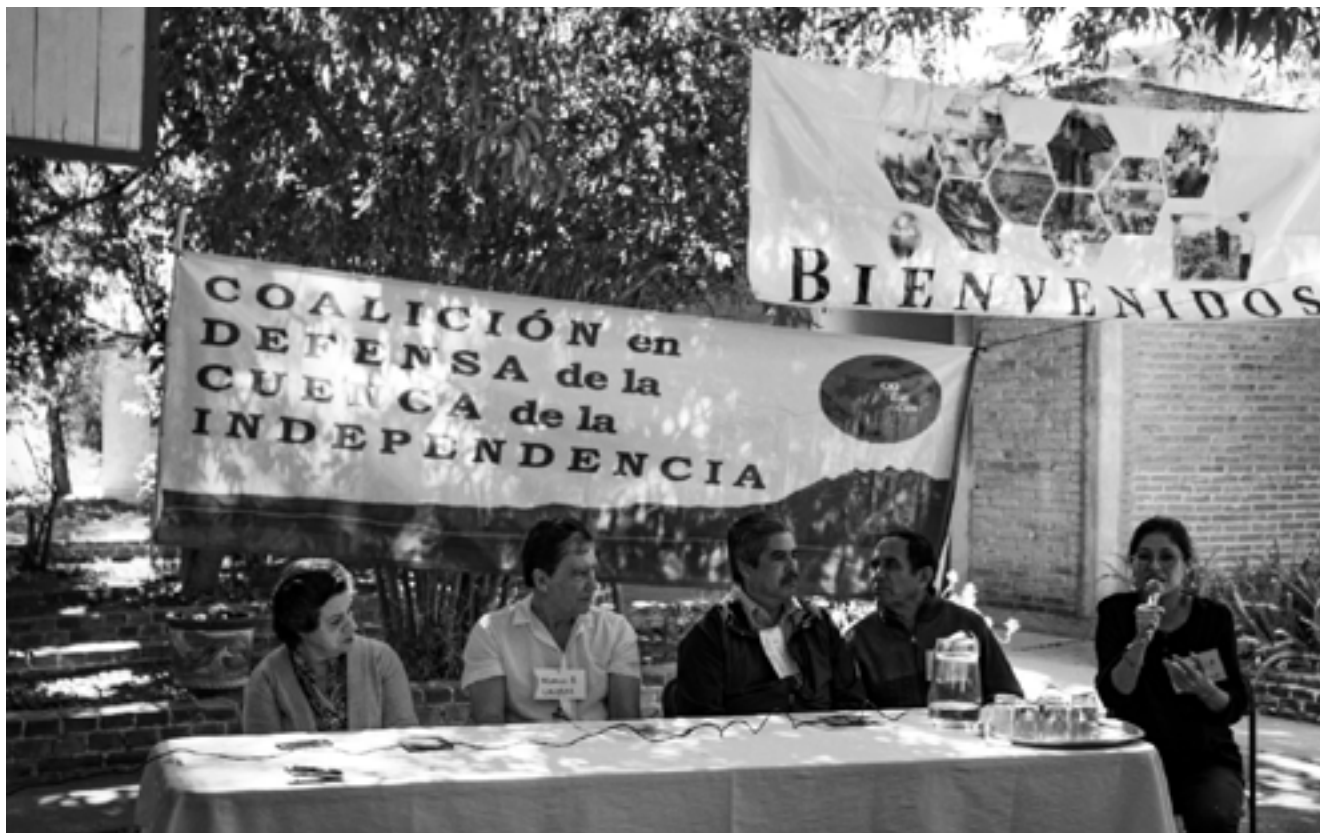
Presentación de los impactos socioambientales en la Cuenca de la Independencia, diciembre de 2019.