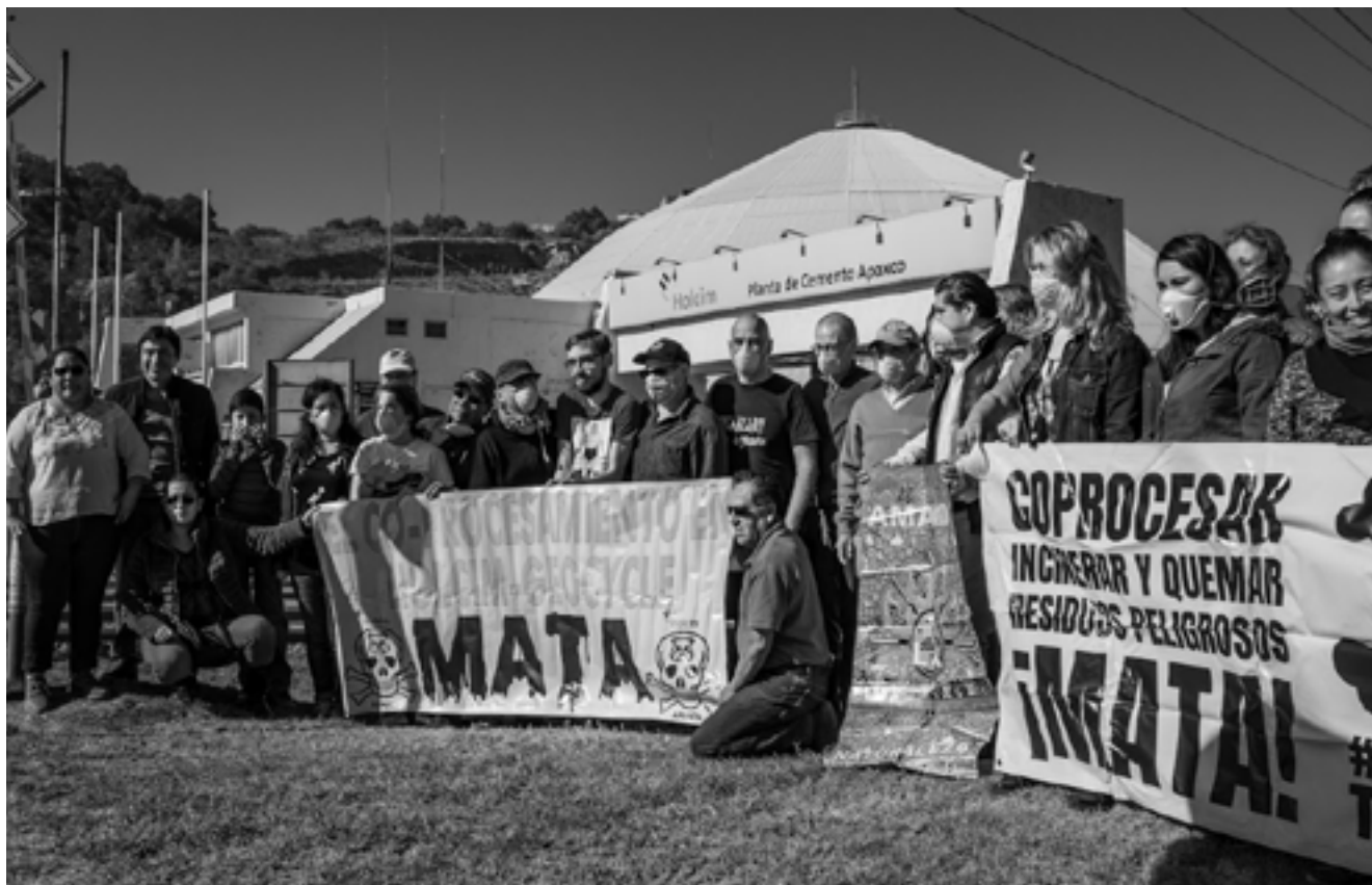
Encuentro con organizaciones de afectadas/os en el Valle de Mezquital, diciembre de 2019.