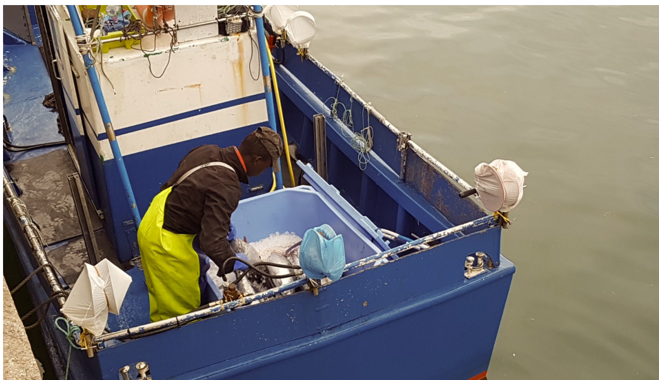
Imagen 13

De 2006 en adelante, la UE comenzó la subcontratación efectiva, coordinada por Frontex, de sus tareas de seguridad fronteriza a los países de África occidental, a través de operaciones como Hera I, II y III, con la esperanza de atrapar a las personas al comienzo de su viaje de migración. "Mediante esta cooperación, los Estados miembros de la UE como Portugal, Italia y España suministraron 2 helicópteros, 2 barcos y alrededor de 10 lanchas patrulleras a Mauritania, el Senegal, Gambia y Cabo Verde." 96 La ruta marítima a España por el Atlántico perdió importancia y en 2012 sólo se detuvieron a 173 personas recién llegadas, aunque esto no tiene en cuenta la cantidad enorme de personas que no sobrevivieron el viaje. 97 Desde entonces, las rutas del Mediterráneo volvieron a cobrar importancia, y una vez más se diversificaron y expandieron rápidamente. 98 Muchas de las personas que se embarcan en los viajes peligrosos a través del Atlántico o el Mediterráneo en busca de trabajo y oportunidades para mantener a sus familias no lo logran (la base de datos de The Migrants' Files registró unas 28.000 muertes desde el año 2000, y es probable que muchas más nunca se contabilicen). 99 Si logran llegar, el racismo institucional, la xenofobia y la amenaza de ser deportadas limitan su capacidad de llevar una vida digna.