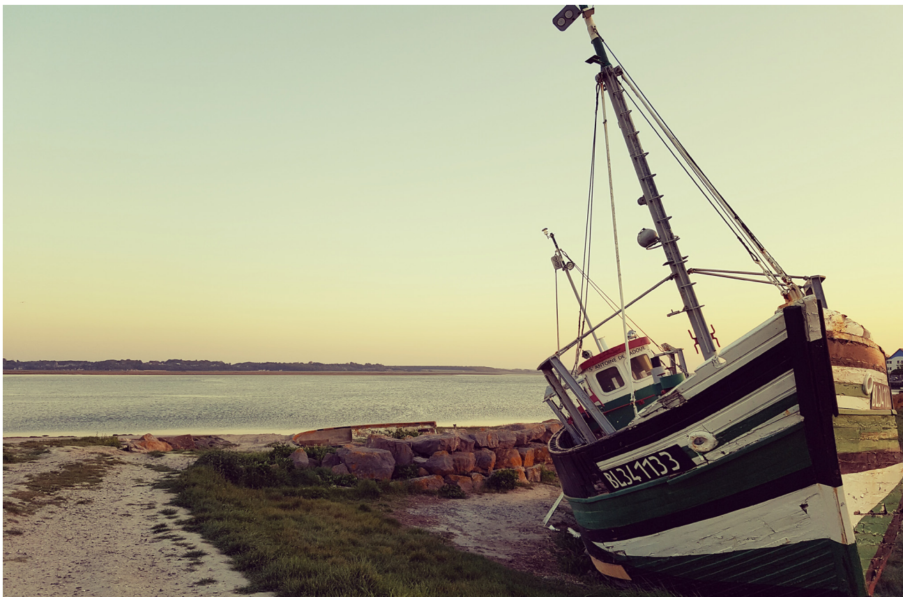
Imagen 14: Barco de pesca francés.

pesqueros por parte de las y los consumidores, incentiva a los buques arrastreros industriales a reducir los salarios para compensar la disminución de las capturas y maximizar las ganancias. Según Seafarers' Rights International , es esta parte de la industria en gran escala que principalmente utiliza la mano de obra no local. 113 "Los migrantes, entre ellos los de países fuera de la EU, se ven a menudo como la solución a las dificultades de contratación de la población local, que a veces consideran a los trabajos de pesca o de procesamiento del pescado como un empleo con salarios bajos y condiciones laborales desagradables." 114