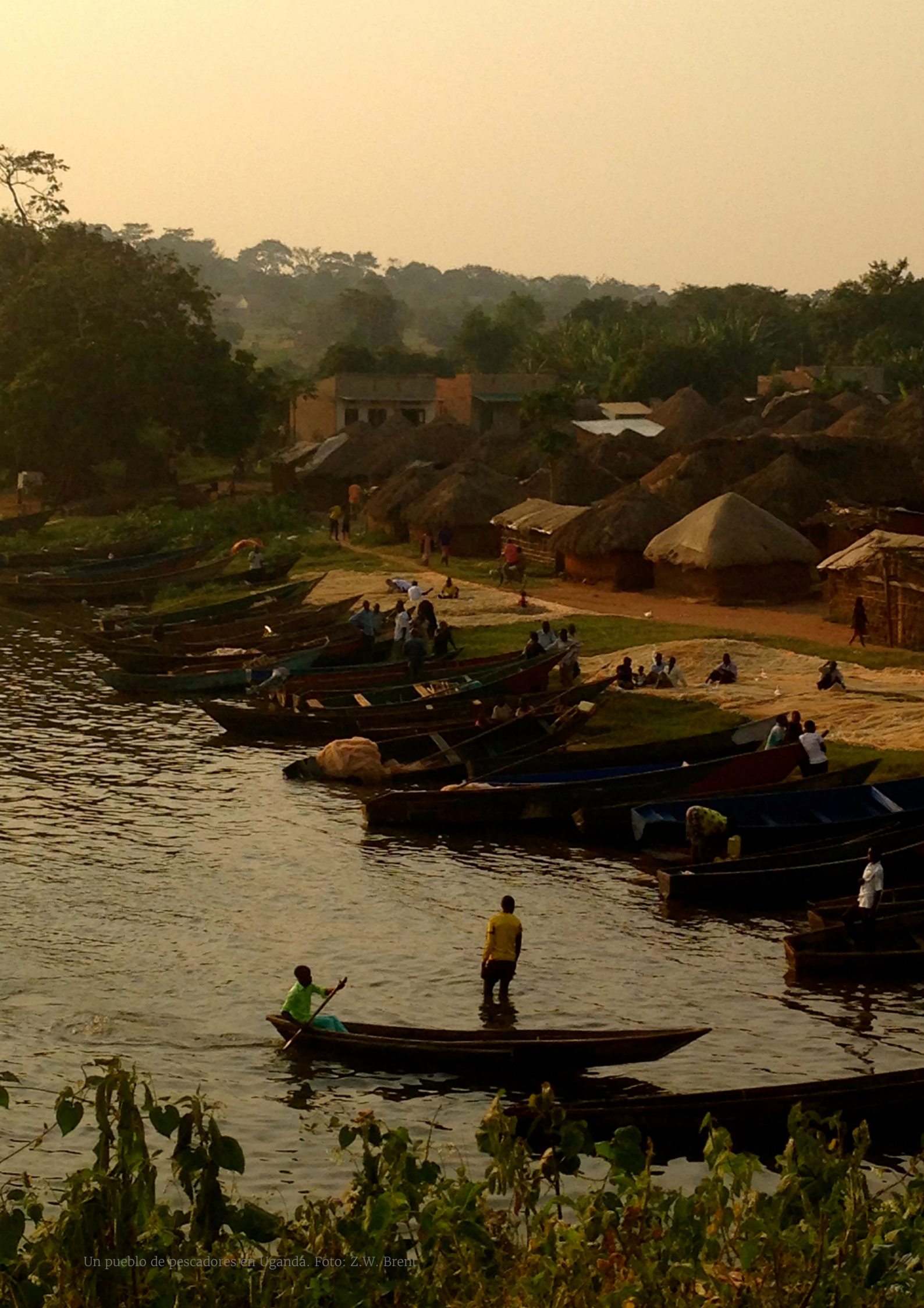
Un pueblo de pescadores en Uganda.