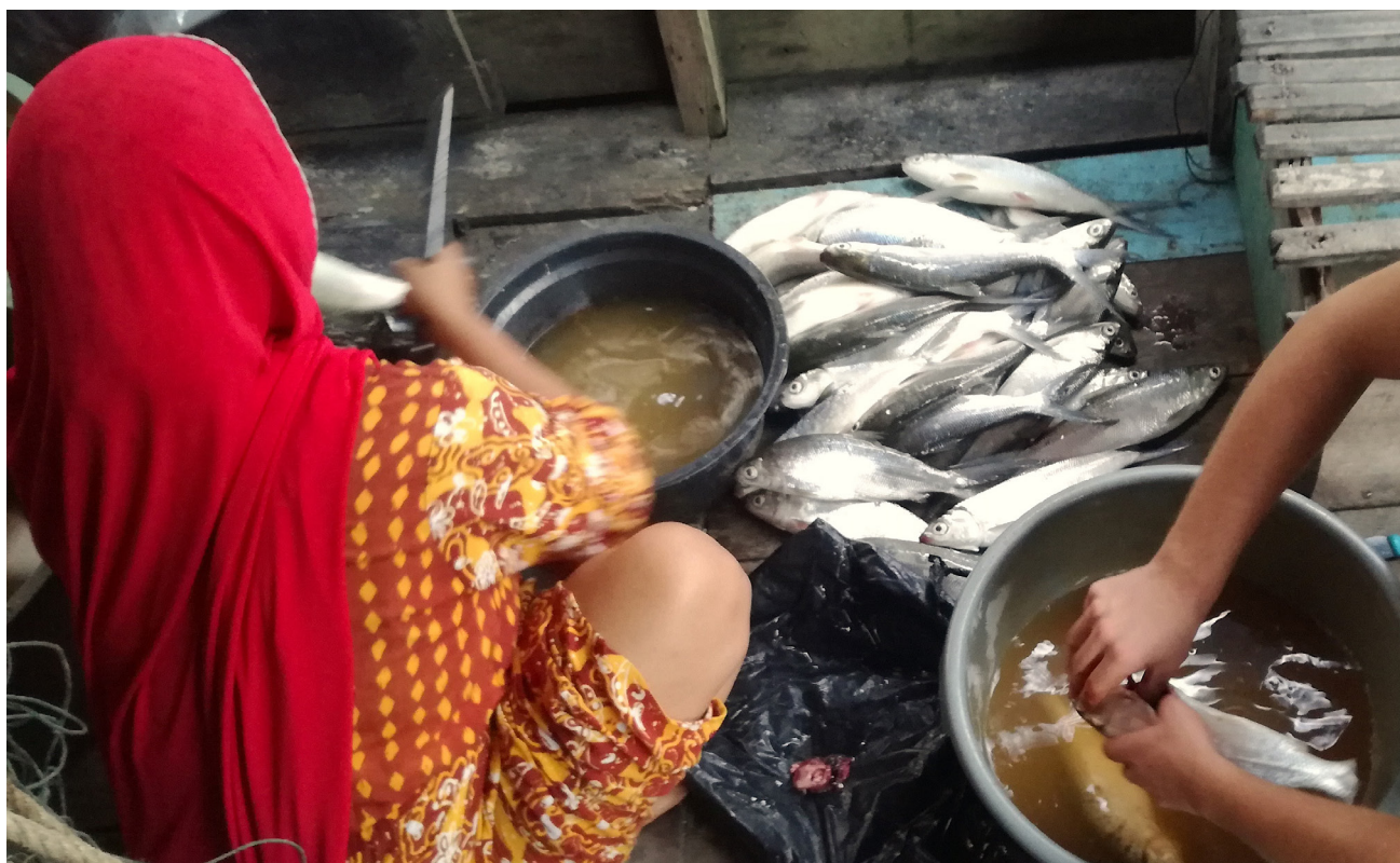
Imagen 10 – Una mujer procesa pescado para el almuerzo, Tarakan, Indonesia.

naturales y así se reafirme el control de las personas sobre los recursos naturales necesarios para la producción sostenible de alimentos. 68