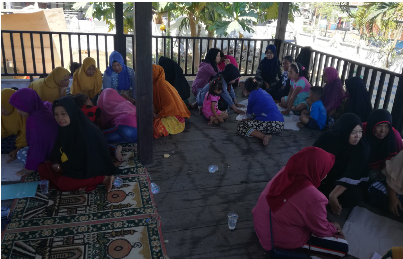
Imagen 12 – Un grupo de pescadoras debaten sobre las estrategias de organización.

proyecto del Puerto Nuevo. Utilizan la educación popular y la investigación en acción para analizar los impactos de género en las comunidades de Indonesia y empoderar a las mujeres para que luchen contra esta situación. Las metodologías de investigación priorizan los espacios exclusivos de mujeres donde buscan concientizar sobre lo que ocurre en las comunidades y en particular entender las perspectivas de las mujeres, sin que los hombres se apropien de su espacio. “Si queremos armar grupos de trabajo, que es importante para trabajar de forma más fácil, cuando las mujeres están en grupos con hombres no se las escucha. Necesitamos nuestros propios grupos.” 82 Estos grupos están recopilando datos e información de forma cuidadosa sobre los procesos de construcción del Puerto Nuevo y sus impactos para así fortalecer el trabajo de incidencia. Las reuniones comunitarias organizadas de esta manera ayudan a juntar datos sobre los impactos de género del desarrollo de infraestructura a gran escala y a la vez apoyan a las mujeres en la organización y construcción de estrategias para resistir a tales políticas, que están profundamente arraigadas en un sistema capitalista y patriarcal.