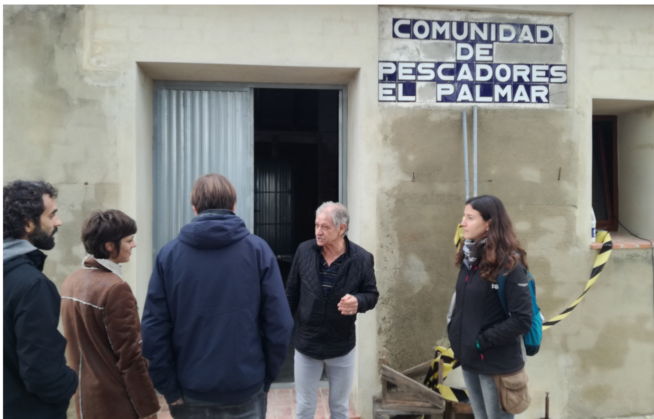
Imagen 5 – Intercambio con los pescadores, El Palmar, Valencia, 2018.

Quizás la conceptualización del aporte de las y los pescadores a la transformación del sistema alimentario se encuentra más a menudo en los documentos y las declaraciones de las asambleas o encuentros de los movimientos de las y los pescadores y activistas en el contexto de debates sobre la soberanía alimentaria (por ejemplo, la Séptima Asamblea General del WFFP en la India en 2017, la reunión del MPP en Brasil, el trabajo del Grupo de Trabajo sobre Pesca del CIP 27 ). También se encuentra en las reuniones de los actores sociales con el movimiento por la soberanía alimentaria donde se mencionan a las y los pescadores y sus luchas, a veces sólo en breve o con un enfoque limitado: la declaración de las organizaciones de productores de alimentos en pequeña escala y organizaciones de la sociedad civil en el Segundo Simposio Internacional sobre la Agroecología convocado por la Organización para la Alimentación y la Agricultura (FAO por sus siglas en inglés) 28 en abril 2018; la declaración del Primer Congreso Nacional de Labradores y Trabajadores Agrícolas en Brasil en 2012 donde participaron el MPP y la CPP 29 ; el webinar sobre la COVID-19 y las y los pescadores artesanales en África Septentrional y Palestina organizado por la red de soberanía alimentaria de África septentrional y el Transnational Institute en mayo de