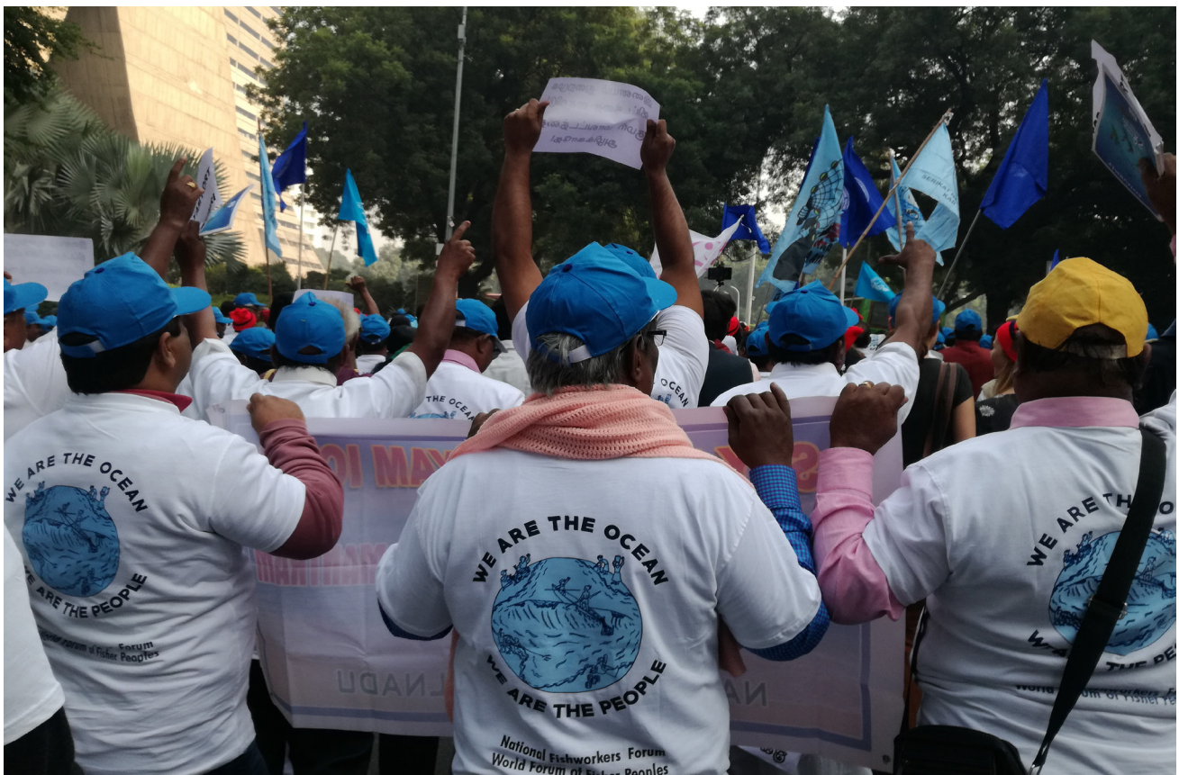
Imagen 3 – La asamblea general del WFFP, 2017.

del movimiento por la soberanía alimentaria. Por ejemplo, aunque algunas de las prácticas de producción alimentaria territorial afectan en gran medida a la salud de las vías fluviales debido a la escorrentía o la contaminación de los acuíferos, no se perciben las amenazas a la pesca del uso de plaguicidas y las hormonas en la agricultura y la ganadería industriales. Por lo tanto, las redes y coaliciones de soberanía alimentaria a menudo no tienen en cuenta a las y los pescadores en pequeña escala, mientras que las organizaciones pesqueras que se enfrentan al acaparamiento de los océanos, la disminución de las poblaciones de peces y la marginación económica no suelen ser escuchadas.