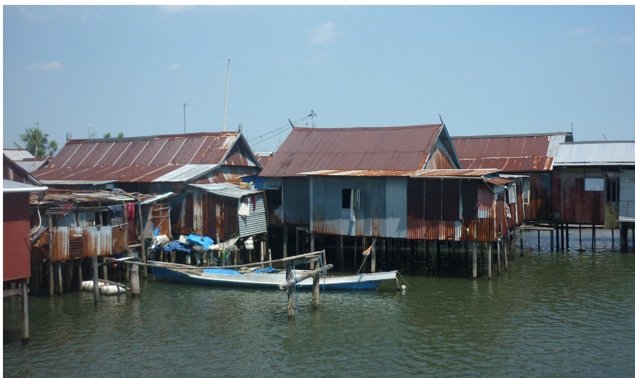
Imagen 11 – Un pueblo de pescadores en las afueras de la ciudad de Makassar.

La falta de acceso a las zonas de pesca socava los medios de sustento de los hombres pescadores, y esto puede generar lo que quizás se entiende como una crisis de masculinidad en un contexto donde los papeles de género en