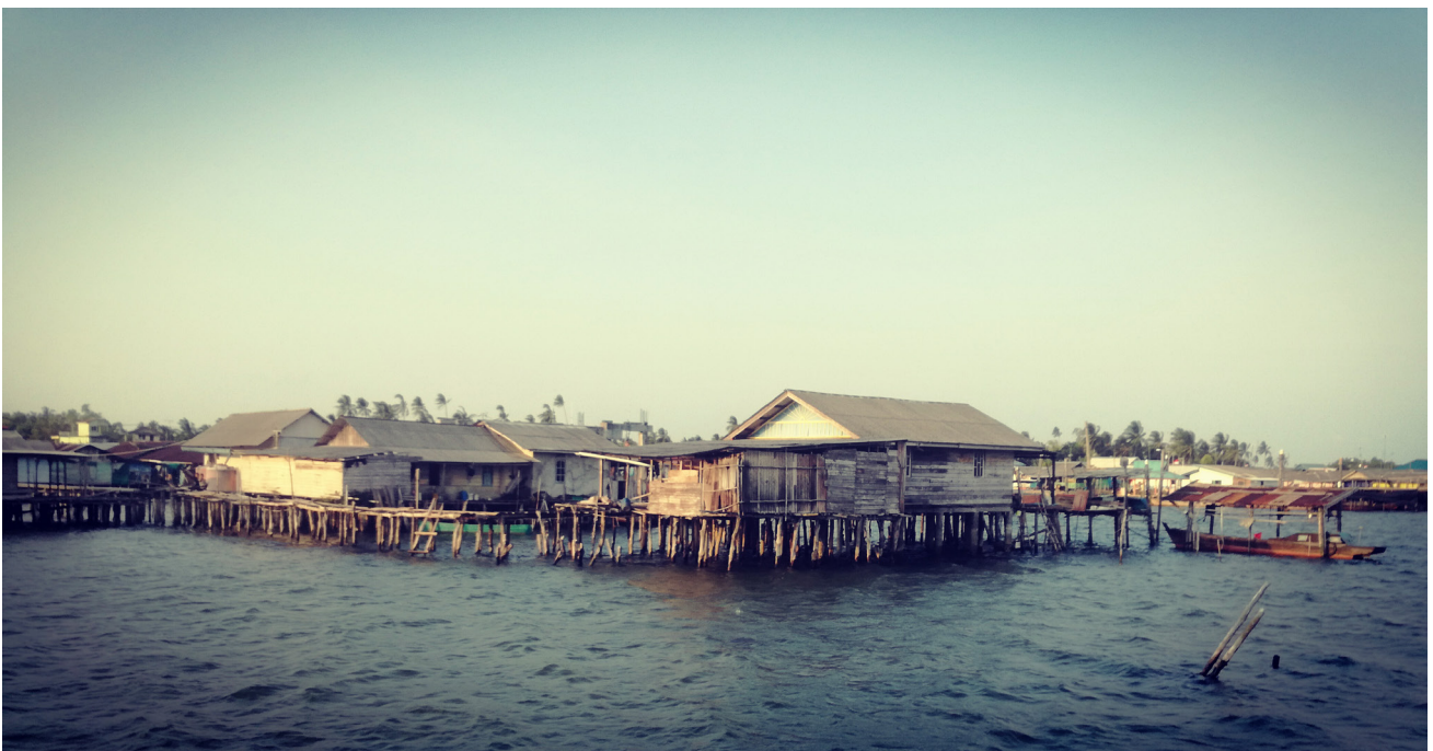
Imagen 6 – Un pueblo de pescadores en Indonesia.

Aunque no se trata de un repaso exhaustivo, estas publicaciones, directrices y declaraciones muestran instancias clave, que han aumentado en el último decenio, en las que el lenguaje de la soberanía alimentaria se vincula a las comunidades pesqueras, incluso por parte de las instituciones donde las y los pescadores en pequeña escala no establecen la agenda política. En otras instancias, las organizaciones lideradas por pescadoras y pescadores han formulado sus luchas en sintonía con los movimientos de soberanía alimentaria y así han fortalecido las alianzas mutuas.