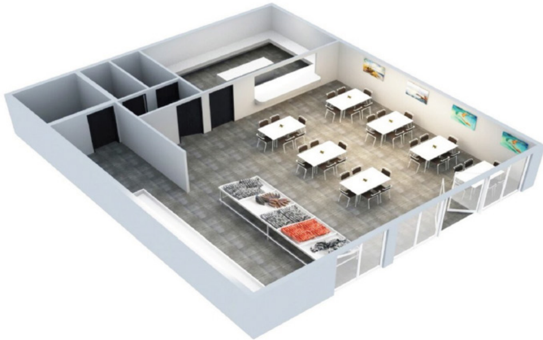
Imagen 9 – Diseño de una tienda cooperativa de 200m2 con espacios para vender, procesar, cocinar, y comer pescado y para actividades culturales (fuente: Folleto del proyecto “Conozca a su pescador”)

cooperativas e iniciativas agroecológicas de consumidores y cooperativas pesqueras para diseñar dichos mercados de agricultores o productores.