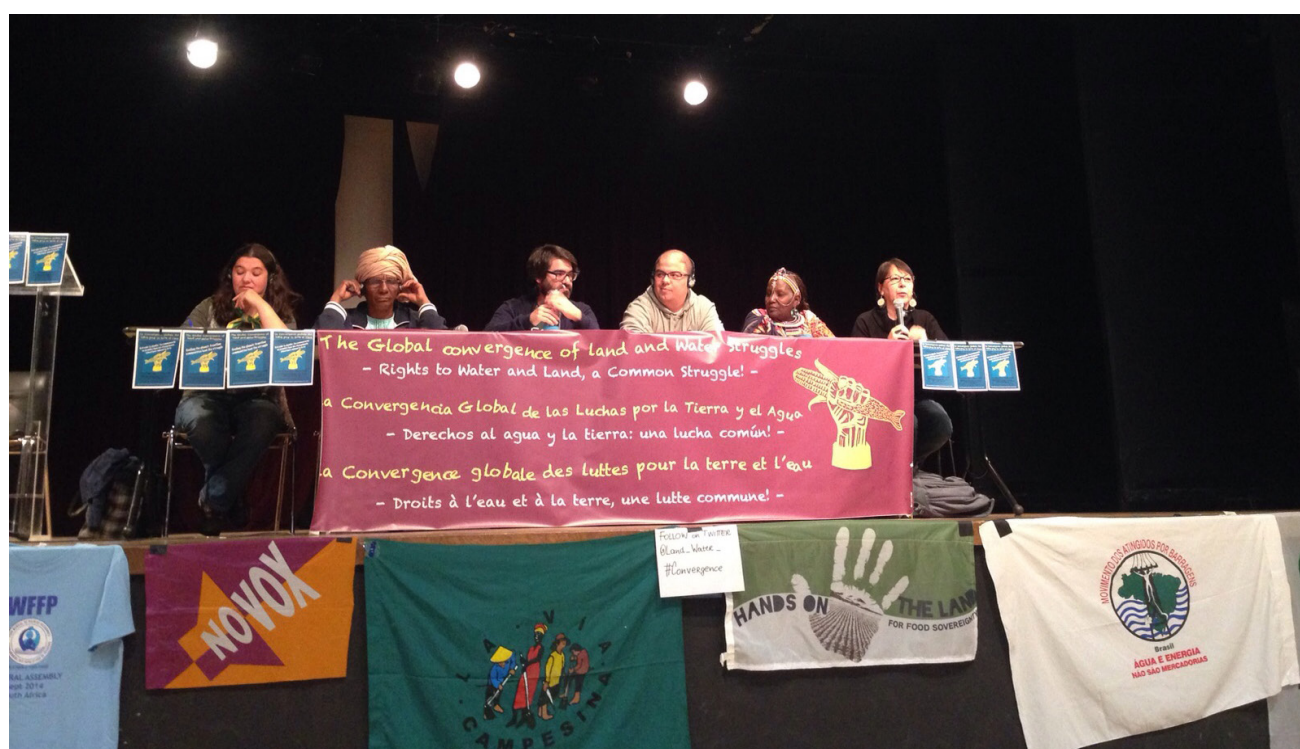
Imagen 2 – La convergencia de las luchas por la tierra y el agua, COP21, 2015.

Aunque las luchas por la soberanía alimentaria tanto en la tierra como en el agua (incluyendo los océanos, mares, zonas de agua dulce y la pesca interior en ríos o estuarios) comparten muchas similitudes, muchas veces hay poca conciencia de las dinámicas específicas de la pesca en pequeña escala, los desafíos que enfrentan las y los pescadores y las soluciones que proponen; incluso dentro