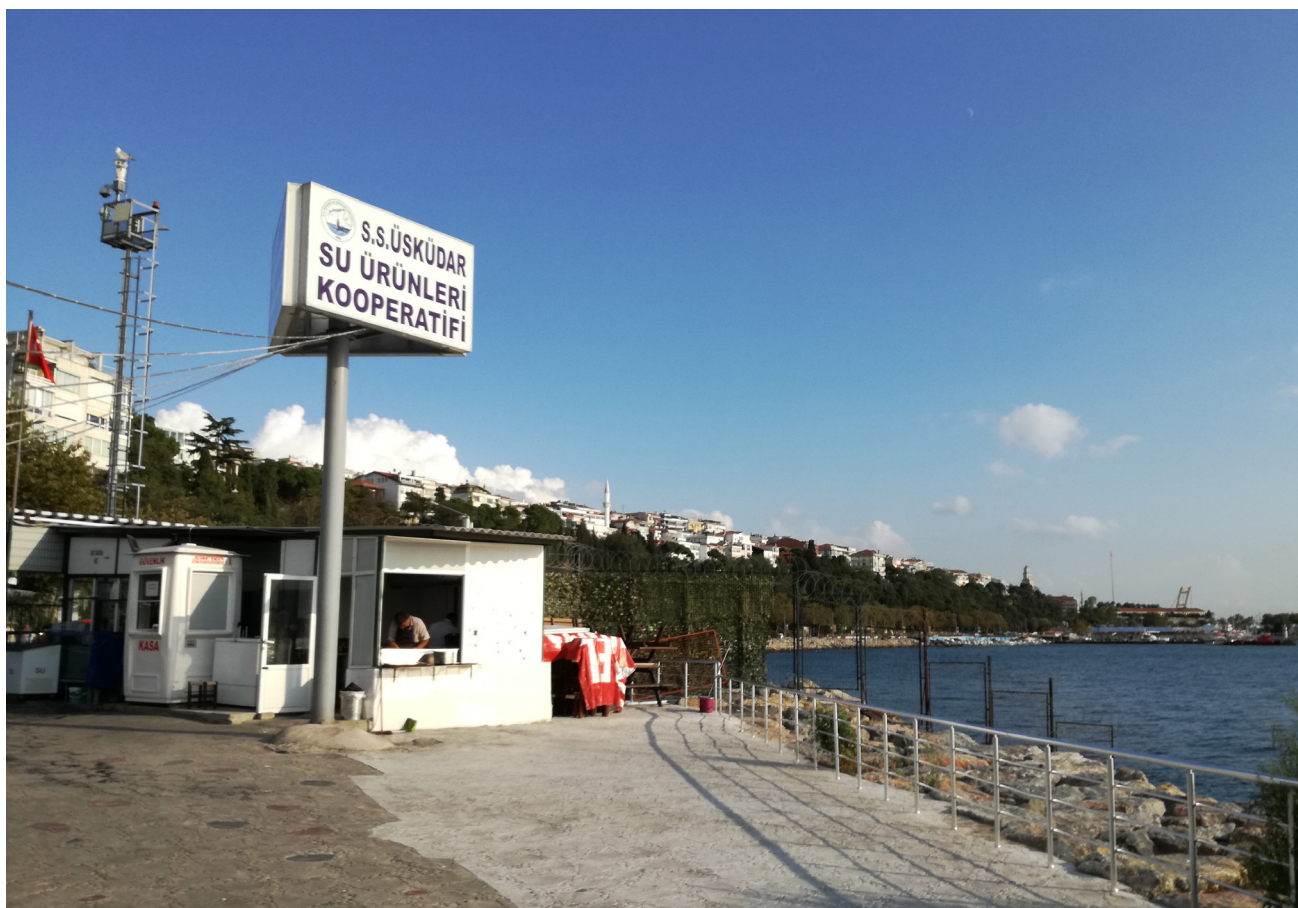
Imagen 7 – Cooperativa afiliada a Birlik Estambul.

En un ambiente así, la visibilidad y el poder político de Birlik Estambul resultaron fortalecidos por la colaboración con una variedad de organizaciones y actores de la sociedad civil como Greenpeace y Slow Food, grupos de consumidores, chefs de restaurantes, periodistas y académicos de disciplinas como la biología, la economía de la pesca, la ingeniería de la pesca y la acuicultura, y