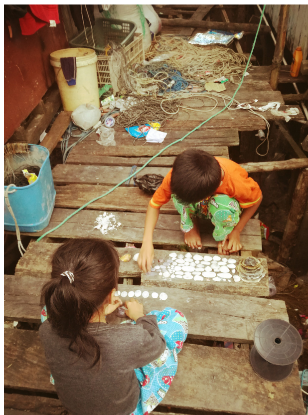
Imagen 1 – Un pueblo de pescadores en Indonesia

A su vez, la respuesta de las y los pescadores en pequeña escala a la COVID-19 ha demostrado que ya se dispone de gran parte del conocimiento y la infraestructura para construir la soberanía alimentaria. Las redes de venta local directa han experimentado un auge y contribuyen a la construcción de sistemas alimentarios más resilientes. Los intercambios entre comunidades pesqueras y campesinas ofrecieron soluciones y seguridad alimentaria a aquellos en circunstancias económicas precarias. Aunque la mayor parte de la investigación en la que se basa este informe se llevó a cabo antes de estos cambios decisivos y, por ende, no se centra en la pandemia, se señalan algunos puntos que destacan la pertinencia de estos temas en el mundo posterior a la COVID19.